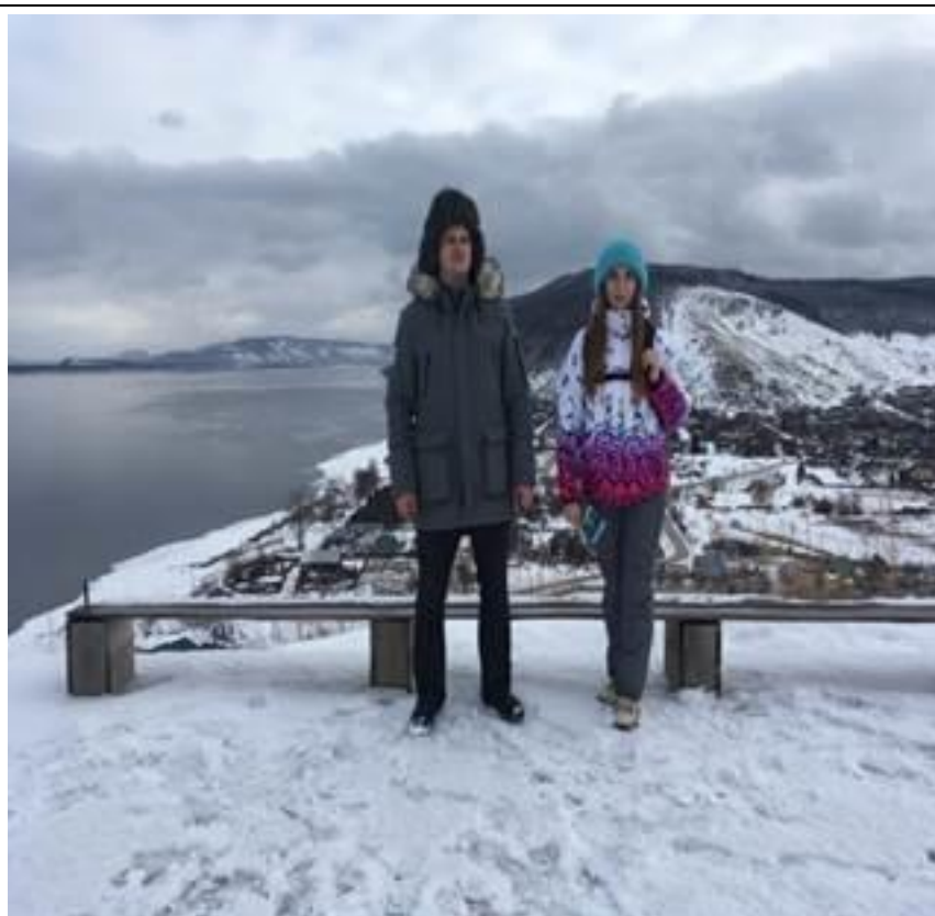
Смотровая площадка горы Поповой