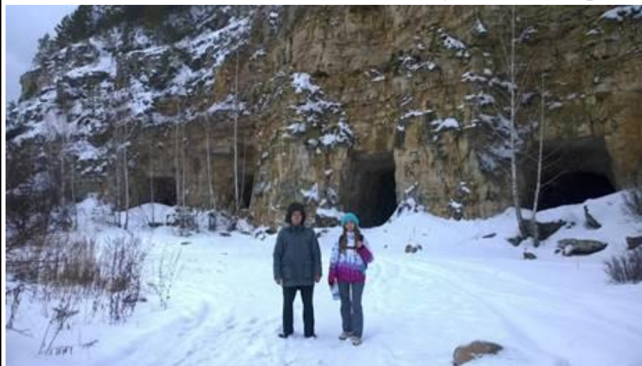
Ширяевские штольни (вид снаружи).