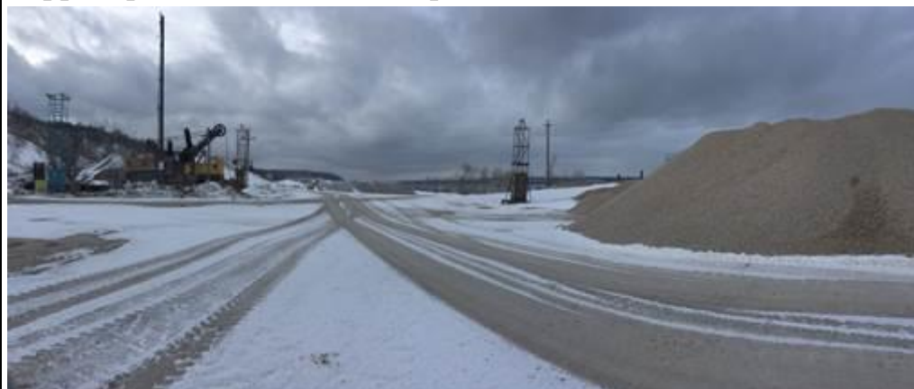
Станция добычи известняка, неподалёку от села Ширяево.