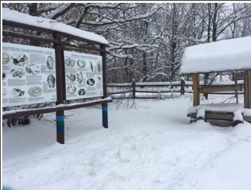
Территория «Ведьминого озера».